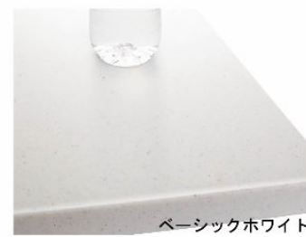
人造大理石トップ

インテリアに合わせてカラーコーディネート。耐久性にも優れた人造大理石トップです。